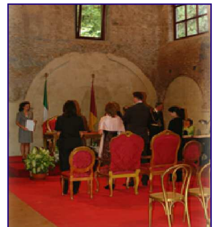
Beide oberen Fotos: Standesamt Complesso Vignola Mattei